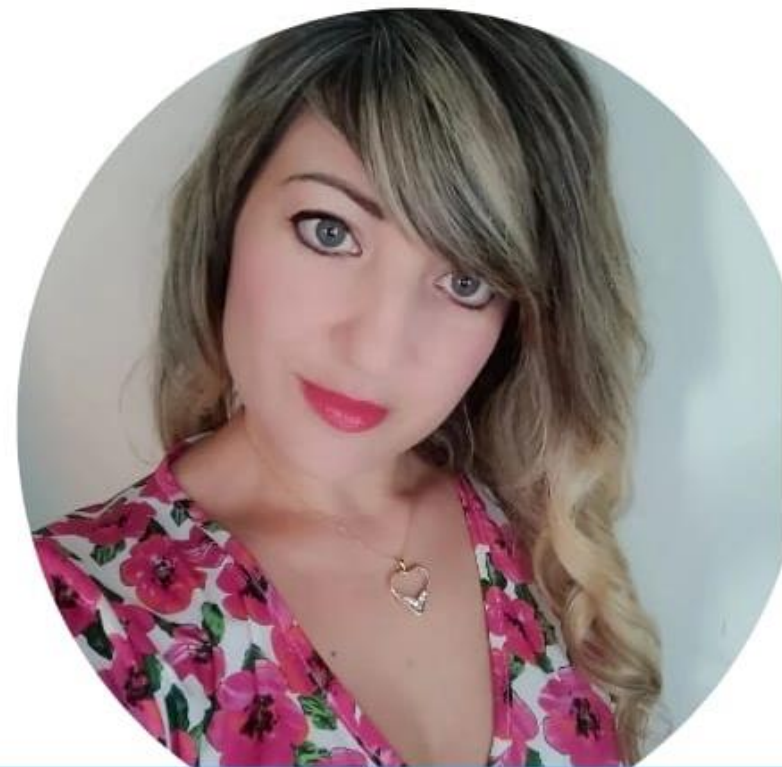
Vanessa Acri Scuola Primaria

Voglio una scuola ove integrazione e inclusione non siano solo belle parole sulla carta ma qualcosa di reale e concreto. Voglio che i docenti si sentano motivati nel loro lavoro perché adeguatamente riconosciuto nella sua dignità e adeguatamente remunerato. Voglio docenti con la voglia di portare i bambini in gita perché lo Stato gli riconosce la trasferta e li tutela giuridicamente. Voglio una scuola che abbia ambienti idonei all'apprendimento e con i giusti strumenti e non tanti fondi investiti male a causa dei troppi vincoli imposti. Insieme possiamo! Scegli NoiScuola Bene Comune.